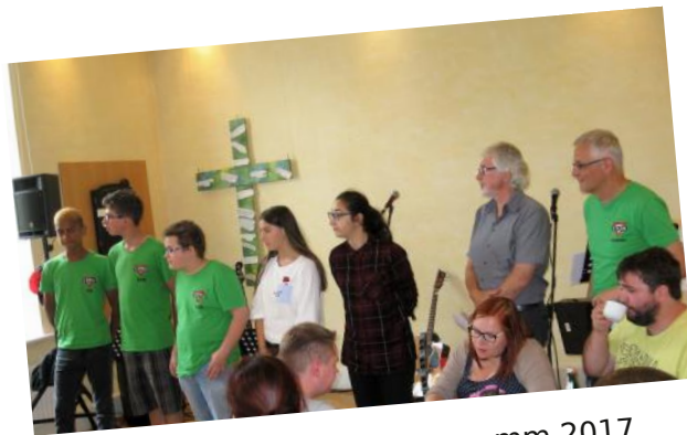
Abschluss-Trainee-Programm 2017 Verleihung der Urkunden

Kinderferienwoche vom 30.10. - 3.11.2017 im CVJM-Haus Unterdörnen 47